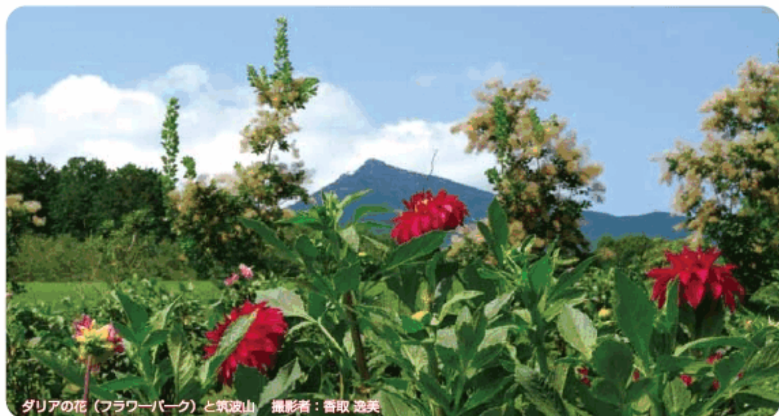
ダリアの花（フラワーパーク）と筑波山

発行所 総合病院 土浦協同病院 発行人 家坂 義人 〒300-0053 茨城県土浦市真鍋新町11-7 TEL029-823-3111