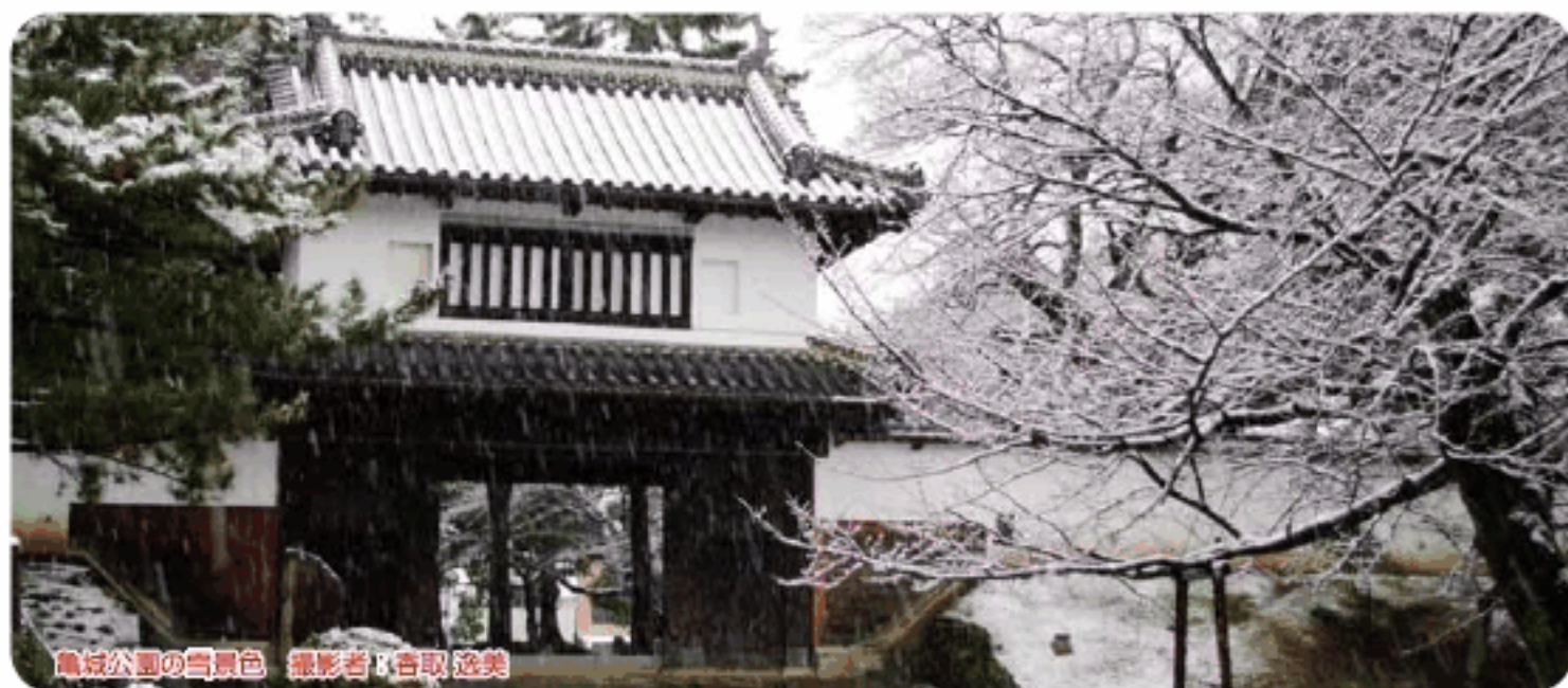
亀城公園の雪景色

発行所 総合病院 土浦協同病院 発行人 家坂 義人 〒300-0053 茨城県土浦市真鍋新町11-7 TEL029-823-3111